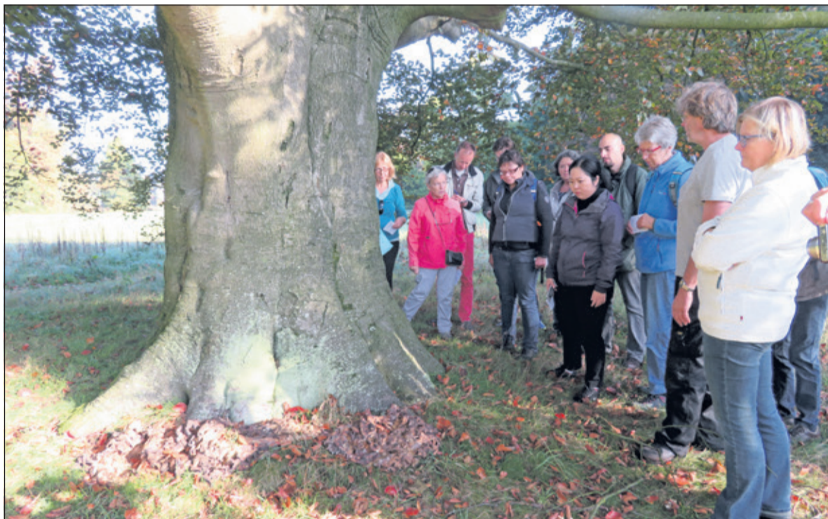
Belangstelling voor mooie structuren op de voet van de boom.