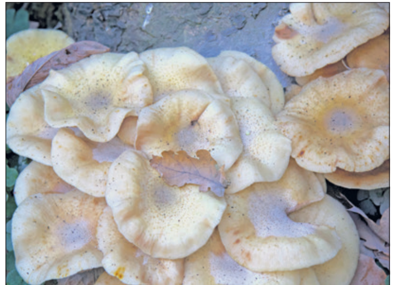
Mooie structuren op de voet van de boom.